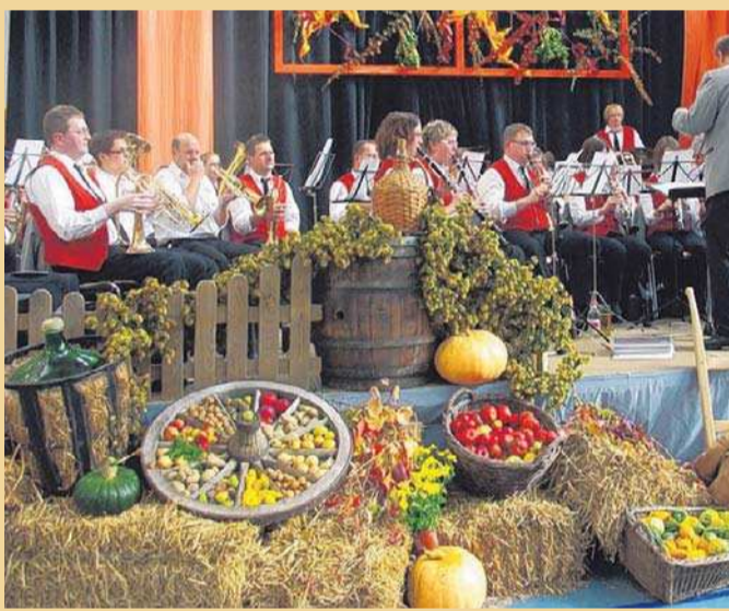
Die herbstliche Dekoration in der Göge-Halle sorgt für farbenfrohes Ambiente.

In gewohnter Weise bietet der Musikverein Göge-Hohentengen an diesem Tag einen reichhaltigen Mittagstisch, der neben den offenen Denketischen noch allerhand Schmackhaftes zu bieten hat. Ab 14 Uhr gibt das Jugendor-