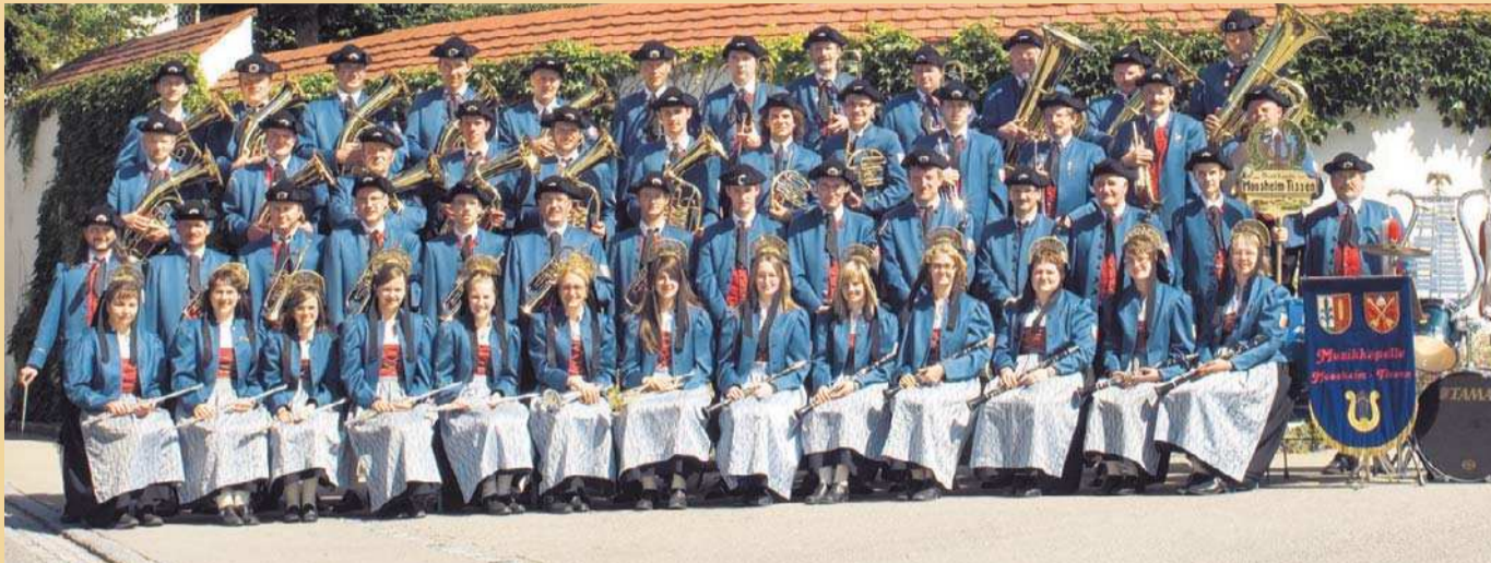
Die Aktiven des Musikvereins Moosheim-Tissen sorgen für den musikalischen Festausklang.